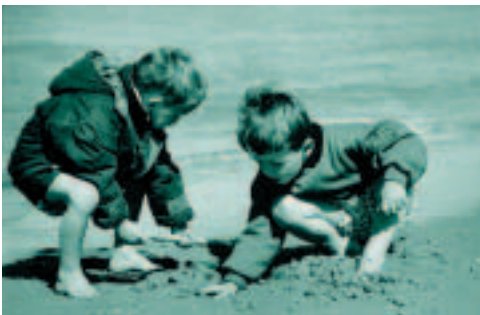
Unten: Die EADS ist seit 1998 Schirmherrin der „l'Envol“-Zentren

Zum anderen investieren wir in geeignete Forschungs- und Entwicklungsmaßnahmen, um aktiv dazu beizutragen, dass diese länderspezifischen Vorschriften kontinuierlich verbessert werden. Wir unterstützen aktiv die Beteiligung von Mitarbeitern an der Entwicklung von neuen Produkten und Technologien, die dazu beitragen, natürliche Ressourcen zu erhalten, Wiederverwendbarkeit zu fördern und die Umwelt so weit wie möglich zu schonen.