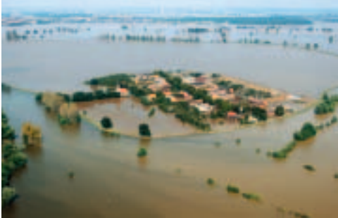
Oben: Die EADS unterstützte Opfer der Flutkatastrophe in Deutschland