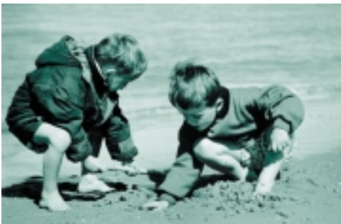
Arriba: EADS prestó ayuda a las víctimas de las inundaciones en Alemania Abajo: EADS es patrocinador de centros "L'Envol" desde 1998

El Código Ético de EADS expone con claridad la conducta que esperamos no sólo de nuestro personal, sino también de aquellos con los que tenemos relaciones, incluyendo a nuestros proveedores. Por ejemplo, desde la constitución de Airbus como sociedad integrada, se ha implantado una política de adquisiciones a escala mundial. Los proveedores están obligados a cumplir esta política como condición para operar con Airbus.